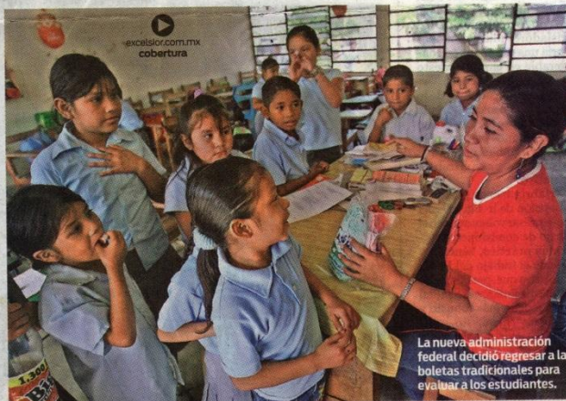
La nueva administración federal decidió regresar a las boletas tradicionales para evaluar a los estudiantes.