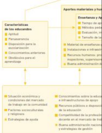
Gráfico 1.1: Esquema para comprender qué es la calidad

¿Cómo estudiar la calidad a la luz de estos planteamientos tan distintos? Uno de los medios para hacerlo consiste en replantearse cuestiones básicas como los objetivos del desarrollo cognitivo y el fomento de los conjuntos particulares de valores, actitudes y competencias que constituyen las finalidades importantes de todos los sistemas educativos. El examen de los elementos principales de estos sistemas, así como de su interacción, nos permite efectuar una descripción útil para coadyuvar a la tarea de entender qué es la calidad, supervisarla y mejorarla.