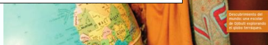
Descubrimiento del mundo: una escolar de Giletti explorando el globo terráqueo.

Ascenso de la economía del conocimiento. En 2006, el sector de los servicios había llegado a ser el que más empleos proporcionaba en todas las regiones del mundo, excepto en el África Subsahariana y el Asia Meridional. Está ganando cada vez más terreno una economía mundial con un elevado componente de conocimientos, que necesita una mano de obra más calificada. Por lo tanto, se han convertido en pilares fundamentales del desarrollo tanto la oferta de una enseñanza primaria de calidad como el desarrollo de sistemas de enseñanza secundaria que fomenten el espíritu crítico y la capacidad para resolver problemas.